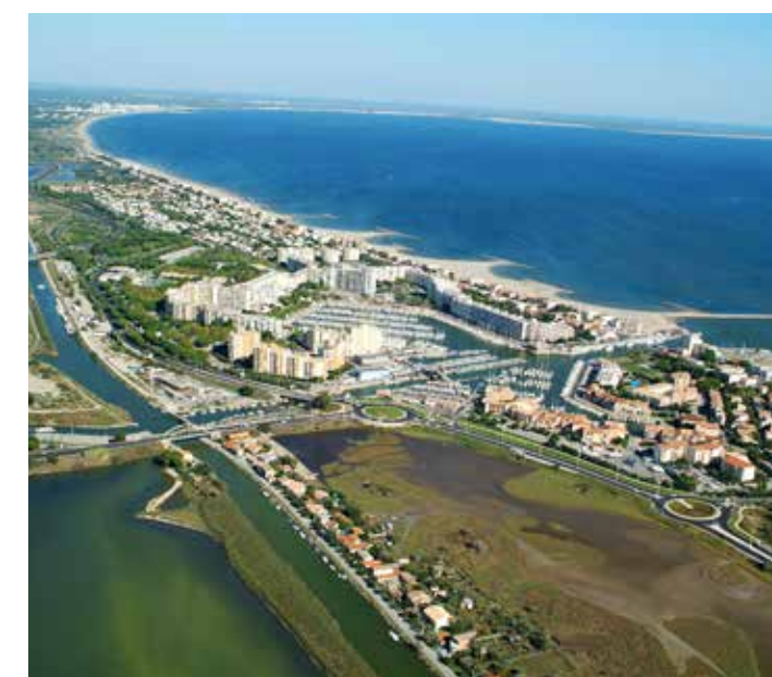
Vue Aérienne du Lido à Carnon

La station balnéaire de Carnon, son cordon littoral et son port de plaisance, en font une destination estivale très prisée des touristes. Les six kilomètres de dunes protégées et de plages