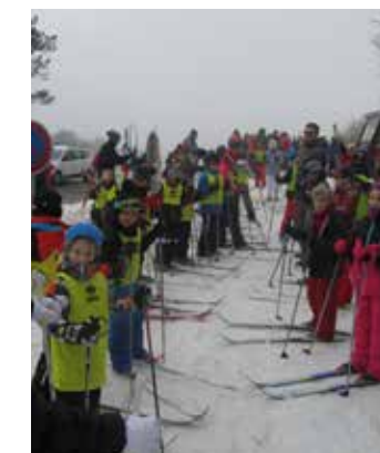
Vacances sportives d'hiver Journée ski Mont Aigoual, Cévennes