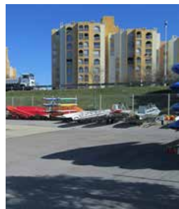
Base d'aviron, Carnon