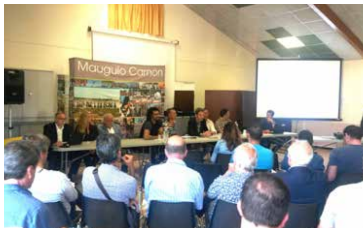
Colloque du 14 avril 2016

Thème 2017 : Mécénat et sponsoring, outils pour financer vos projets (18 avril 2017)