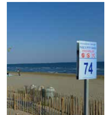
Aire de Kite surf Plage accès 74