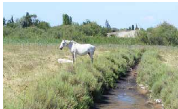
Etang de l'Or - Espace protégé Natura 2000