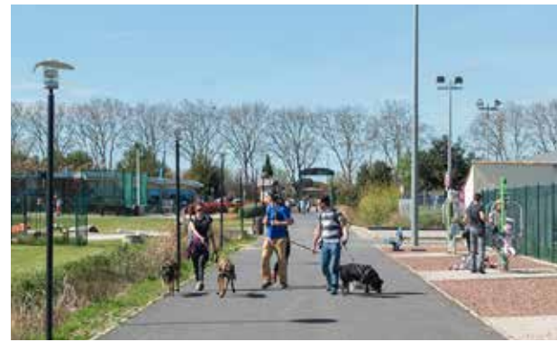
Un matin à la Plaine des Sports

L'autorégulation du site est au centre du fonctionnement. La diversité des publics et des pratiques ont rendu ce site attractif pour tous. Les week-ends voient l'affluence d'une population de masse, essentiellement locale. La mixité des publics accueillis et la qualité du site engendrent une gestion régulée par les usagers. Deux gardiens veillent au bon fonctionnement de l'équipement. Leurs missions sont à la fois de garantir l'hygiène des locaux (vestiaires, toilettes, extérieurs) et d'assurer des rondes quotidiennes du lundi au dimanche de 8h00 à 19h00. Deux agents municipaux (gardiens affectés au service des sports) veillent au bon fonctionnement du site.