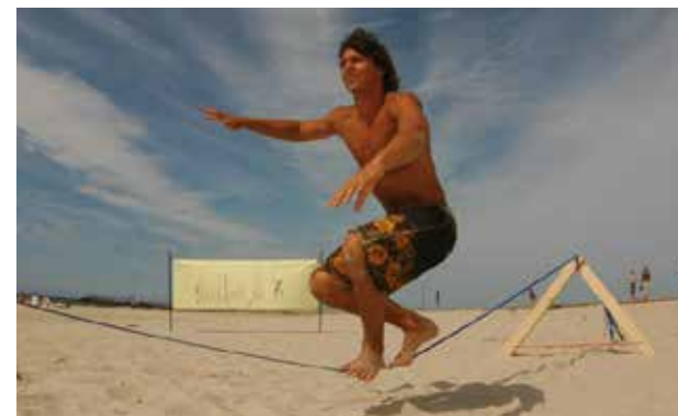
Slackline - Carnon plage