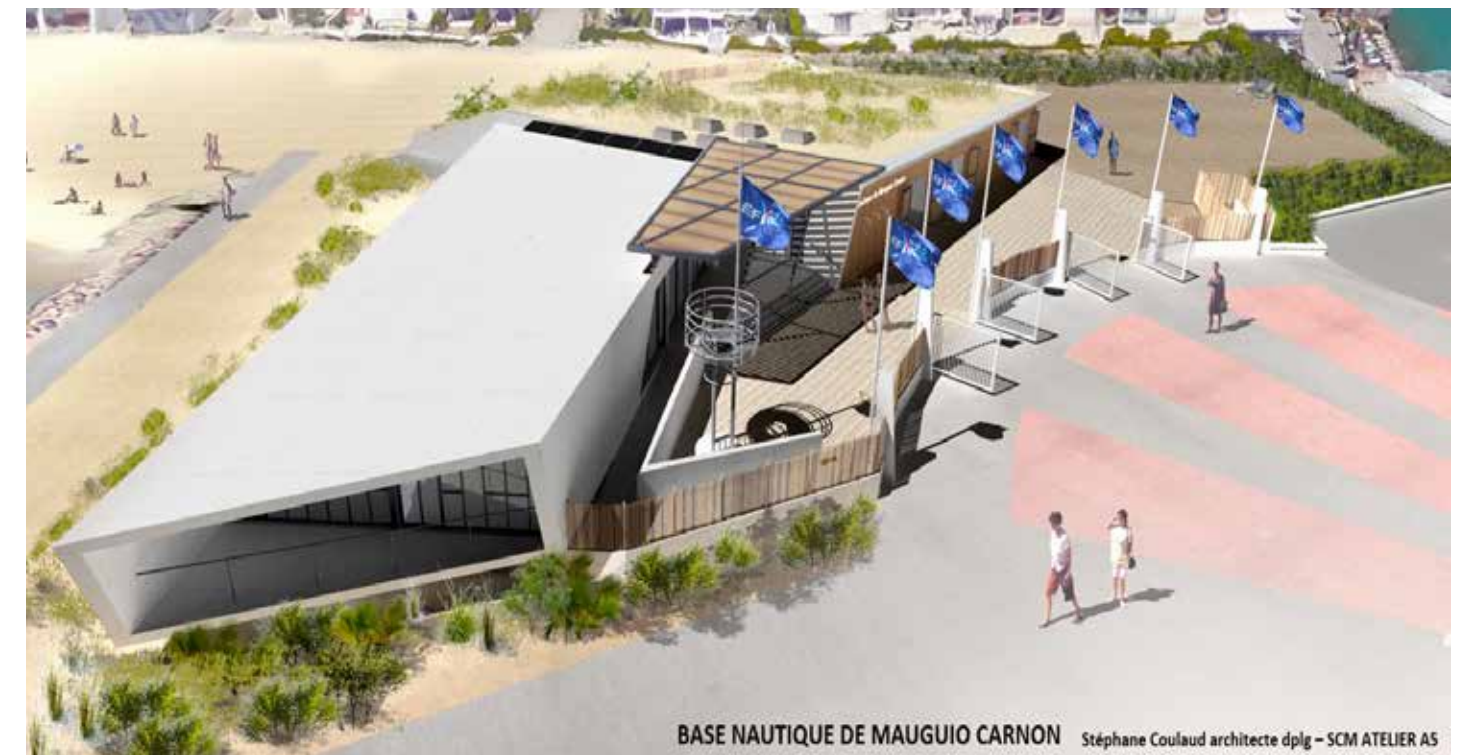
Vue de l'équipement envisagé (Phase DCE)