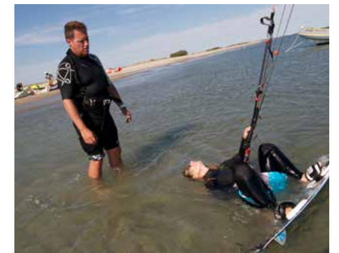
Cours de Kite surf - Plage accès 74, Carnon

Un chenal de navigation homologué par la FF de Vol libre et répertorié au PDESI est mis en place depuis 2012.