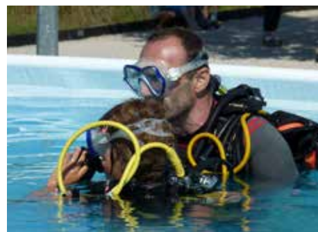
Fête du sport 2017