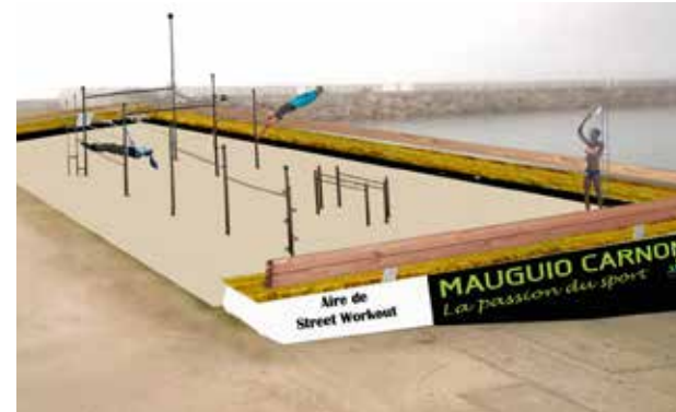
Maquette du futur espace de Streetworkout

La configuration urbaine de Carnon permet difficilement la mise en place d'un parcours de santé, suffisamment dimensionné pour répondre à des attentes de sportifs entraînés. Toutefois, Carnon possède un magnifique réseau piétonnier, véritable poumon vert, agréable et bien entretenu. Le développement d'un ensemble de stations de fitness d'extérieurs, bénéficiant d'une signalétique appropriée, permettra, de structurer un parcours d'entretien physique.