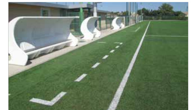
Stade de Football en synthétique

Des animations nocturnes sont proposées par le Pôle jeunesse et médiation de la Commune, durant des périodes spécifiques, sur le « city stade » éclairé pour l'occasion, permettant de nouer des contacts approfondis envers un public non captif.