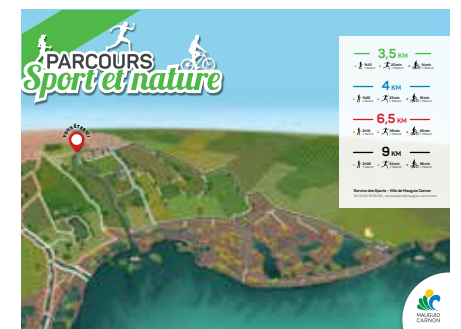
Plan de la plaine des sports