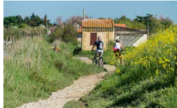
Etang de l'Or - Espace protégé Natura 2000