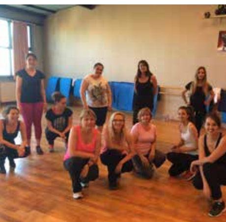
Cours de fitness - Midi sport