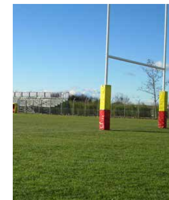
Terrain de Rugby Complexe Léo Lagrange