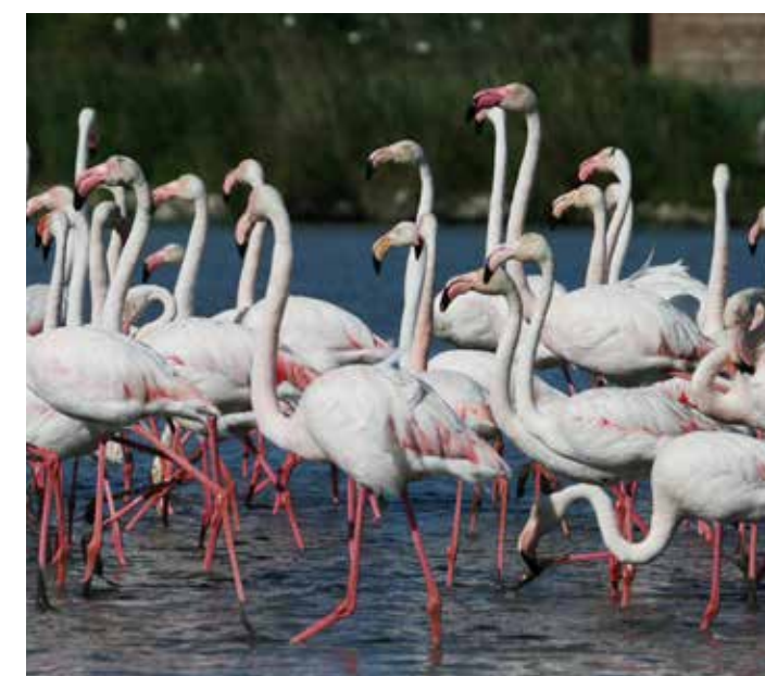
Etang de l'Or

Au Nord-Est de la ville, la ZAC de la Louvade est une autre zone en pleine expansion. De nombreuses entreprises artisanales s'y installent et dynamisent la vie économique. Mauguio Carnon, avec sa vie culturelle et sociale, ses sportifs, sa jeunesse, son agriculture diversifiée, ses commerces de proximité, et ses marchés typiques, possède bien d'autres ressources. Terre nourricière et d'accueil où le soleil sèche les embruns du large, elle met du sel et de "l'aficion" dans le cœur de ceux qui passent... et qui restent.