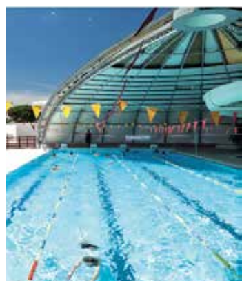
Piscine intercommunale, Mauguio