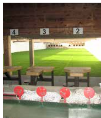
Stand de tir, Mauguio