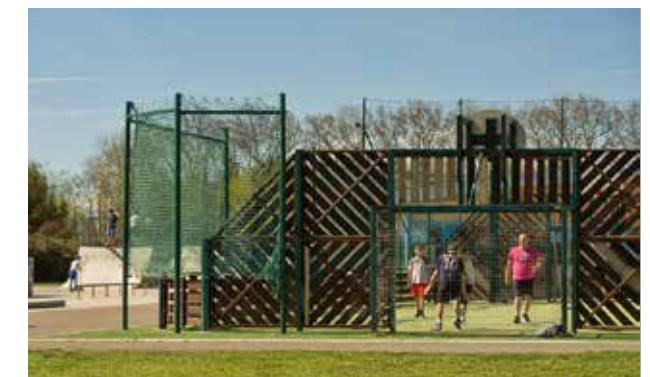
City stade - Accès libre