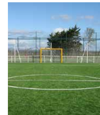
Terrain synthétique Espace Bisciglia, Carnon