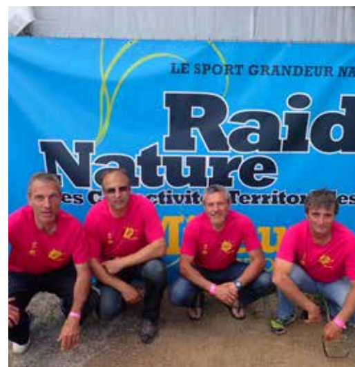
Financement du Raid nature pour les agents de la collectivité