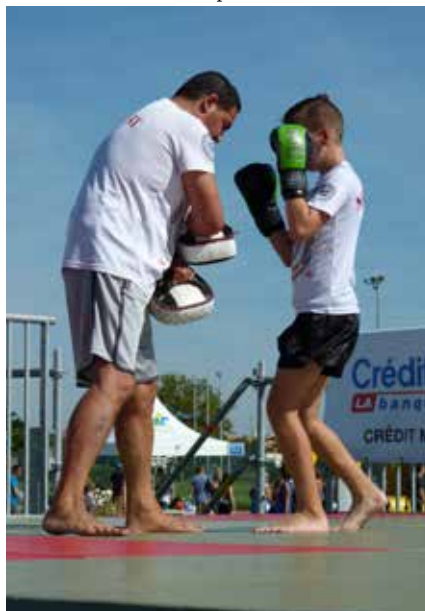
Vacances sportives 14-16 ans