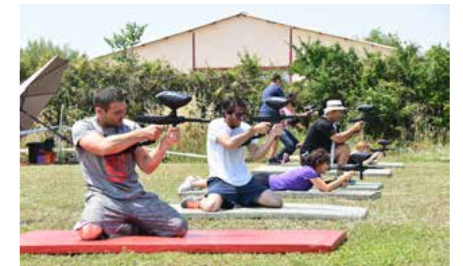
Olympiades - Epreuve de tir

Après deux années d'expérimentation « Midi Sport », soutenu par la direction sport et le service des ressources humaines est en plein essor. L'organisation des olympiades en juin dernier a permis de fédérer et de souder une majorité des agents communaux. Le dispositif est reconduit pour la rentrée 2017-2018, il sera étoffé de nouvelles activités telles que le body karaté, l'escrime, le tir à l'arc et l'aviron.