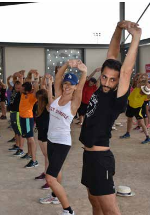
Échauffement des participants des Olympiades

Convaincue des bienfaits du sport sur les axes physiques, mentaux et sociaux, la Commune a développé un concept novateur : proposer du sport à ses agents.