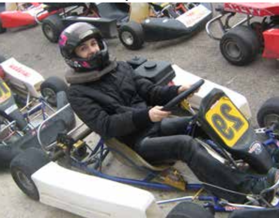
Fête du sport 2017