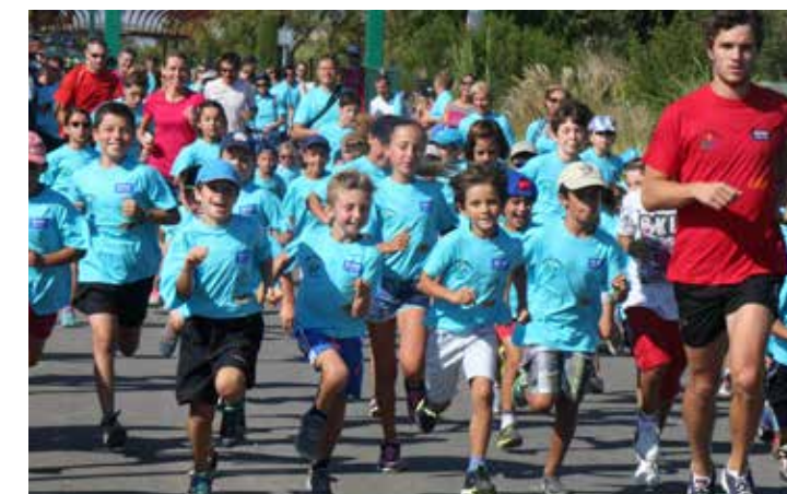
Départ de la course - 2km - 7/10 ans