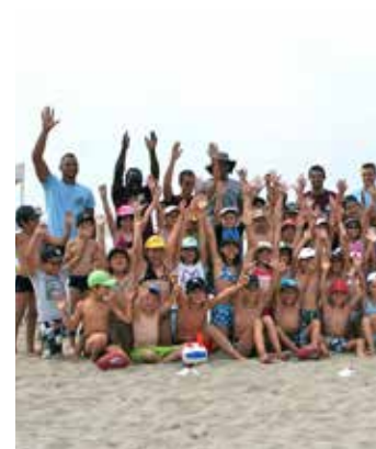
Vacances sportives d'été Découverte du volley Carnon plage

Le budget de fonctionnement de cette opération est 103 000 €.