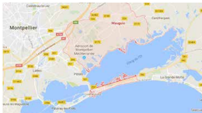
Localisation de la Ville de Mauguio Carnon