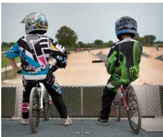
Fête du sport 2017