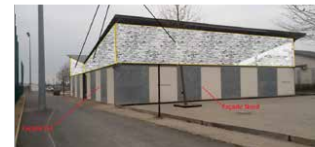
Travaux à réaliser

Coût des travaux : 110 000€ (phase APS en cours)