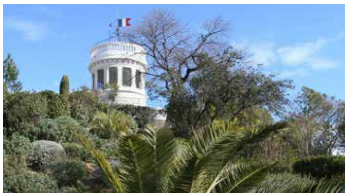
Motte Castrale, véritable emblème de Mauguio

La Commune de Mauguio Carnon, 7 ème ville du département de l'Hérault et chef-lieu de canton, est située à 11 kilomètres à l'est de Montpellier. Elle compte 17 500 habitants.