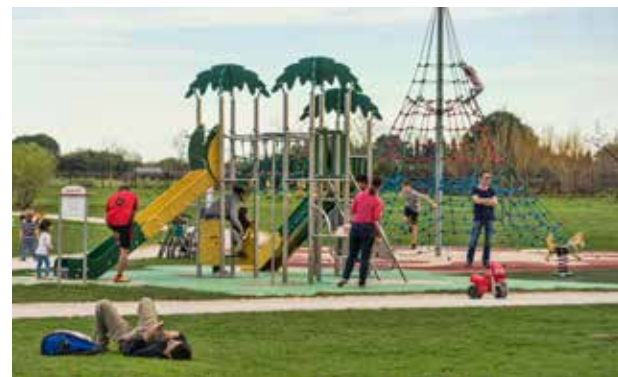
Jeux pour les enfants - Parc paysager