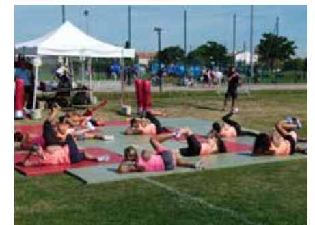
Initiation gym - Fête du sport

De plus, soucieux de proposer à sa population un espace fédérateur et un lieu de vie novateur, la Ville a imaginé un site pluridisciplinaire permettant à un large public de se rassembler. Un site de plus de 10 hectares est consacré aux sports. La Plaine des Sports regroupe les activités organisées (football, hockey sur gazon, pétanque, BMX, skate, tennis) et des pratiques en libres accès sur 3 hectares (parcours de santé, terrains de volley, terrain de football, tennis ballon....)