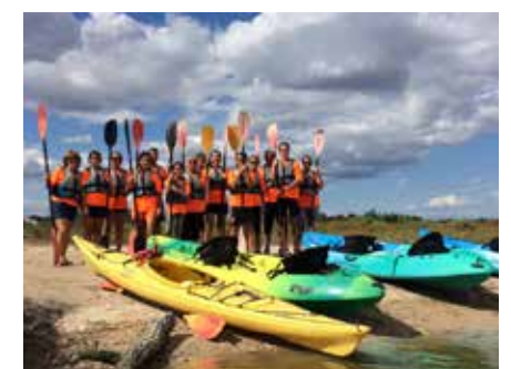
Sortie kayak - Fête du sport