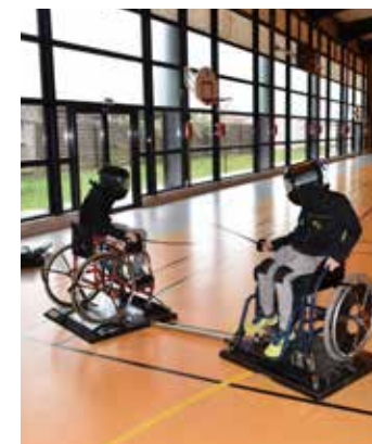
Vacances sportives de Pâques Initiation Handi escrime Gymnase Beugnot, Mauguio