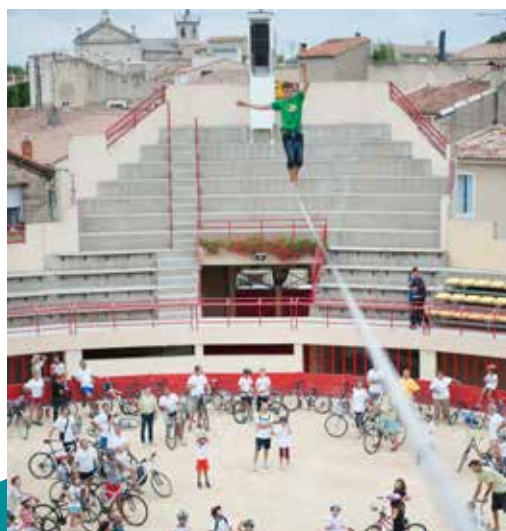
Fête du sport 2016

Ville de Mauguio Carnon Direction Sport Éducation Service des sports