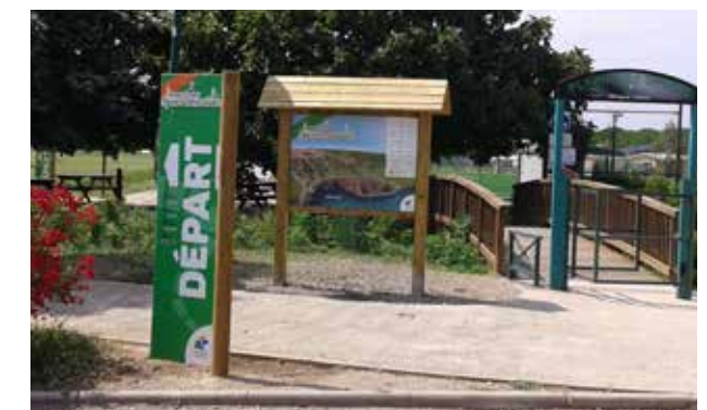
Entrée Plaine des sports - Départ des parcours nature (de 3,5km à 9km)