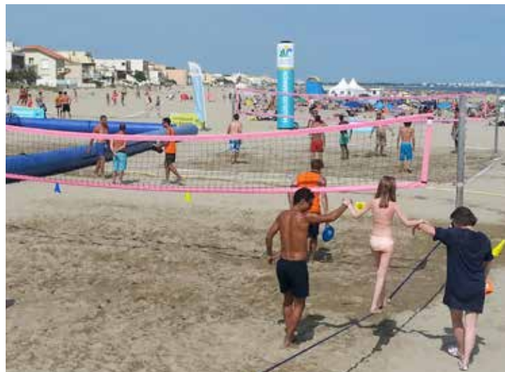
Dispositif d'animation sportive - Plage Cassan, Carnon

Pour l'édition 2017, les activités sont proposées de 9h00 à 10h00 pour la marche nordique puis de 15h00 à 20h00 du mardi au samedi. De nombreuses activités ont été proposées, de la marche nordique, de la slackline, du tir l'arc, du Beach-tennis, de l'aviron, du Beach-soccer, du Beach-rugby, du Beach-volley, du Sauvetage côtier et des séances de Cross fit.