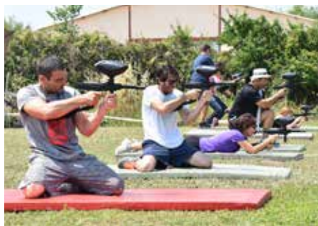
Épreuve de Tir - Olympiades

Elles s'adressent à l'ensemble des agents municipaux.