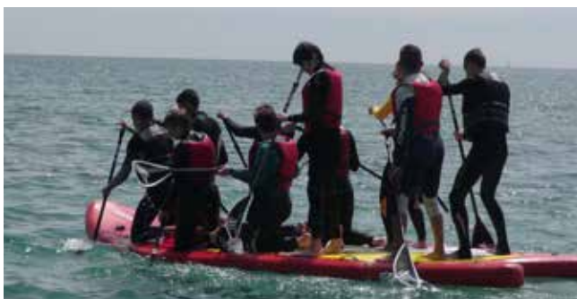
Vacances sportives 14-16 ans