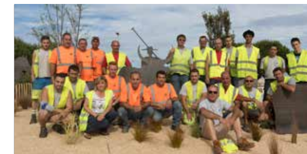
Les agents du service technique, Espaces verts