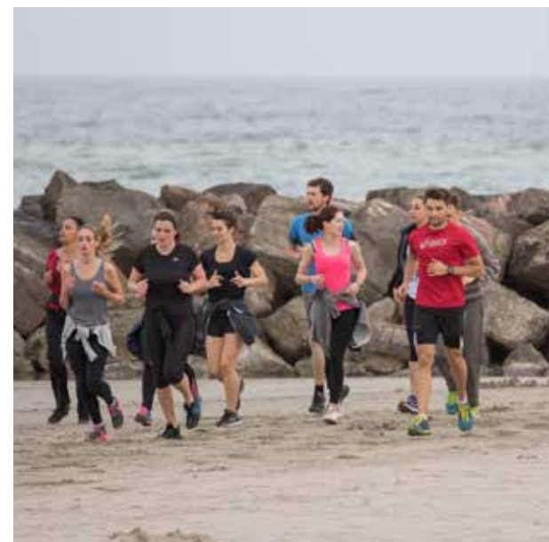
Remise en forme - Carnon plage