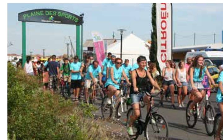
Défilé du Tous'ki roule

L'année 2017 a vu l'installation de deux piscines (l'une pour des baptêmes de plongée, l'autre pour la découverte de la voile légère : Optimist), d'une grue de 50 m pour le saut à l'élastique, d'un parcours du combattant « la Ruée des Fadas » et de nombreuses autres animations.