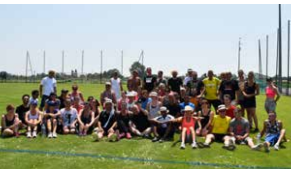
Participants des Olympiades