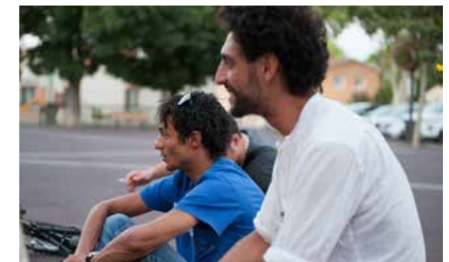
Le service Jeunesse et Médiation en action