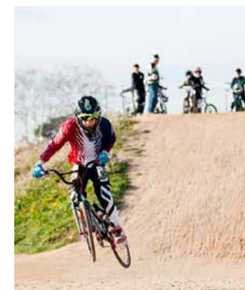
Piste BMX Plaine des sports