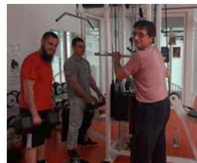
Cours de Musculation - Midi Sport