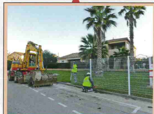
Rue d'Alger Création de 9 places de stationnement dont un emplacement PMR. Coût : 15 000 € TTC