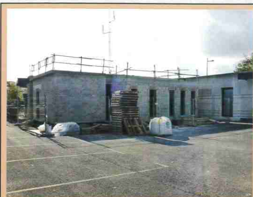
Extension de la gendarmerie avec la création de 4 bureaux, un local de stockage et 3 studios. Début des travaux : septembre 2012 Livraison : 1 er trimestre 2013 Coût : 300 000 € TTC