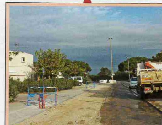
Rue des Épis Aménagement de voirie, rénovation de l'éclairage public et création d'une piste cyclable bidirectionnelle. Début des travaux : octobre, Livraison 1 er trimestre 2013. Coût : 227 000 € TTC