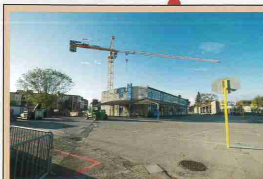
Construction du groupe scolaire Camus-Prévert Livraison du groupe primaire à la rentrée 2013 et de la maternelle début 2014. Coût : 5,2 millions d'€ TTC