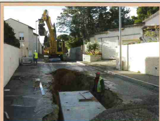
Rue des Colverts : réfection de voirie. Début des travaux : novembre, Fin des travaux prévue 1 er trimestre 2013. Coût : 274 000 € TTC