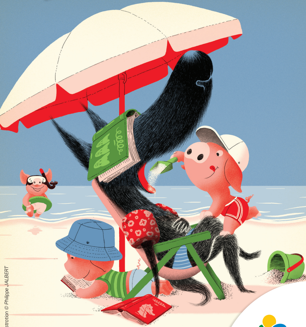
Illustration © Philippe JALBERT