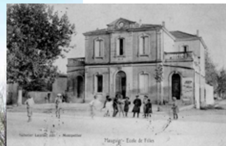
Un patrimoine préservé