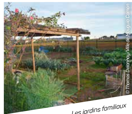
Les jardins familiaux