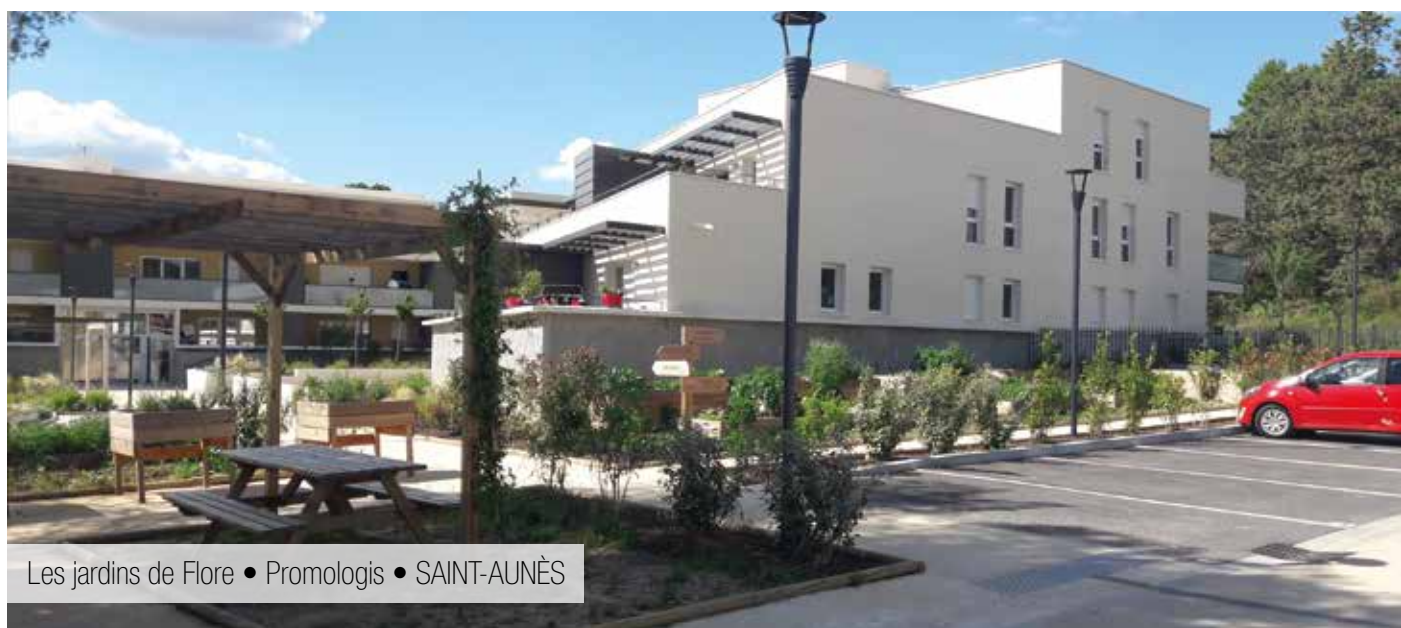
Les jardins de Flore • Promologis • SAINT-AUNÈS